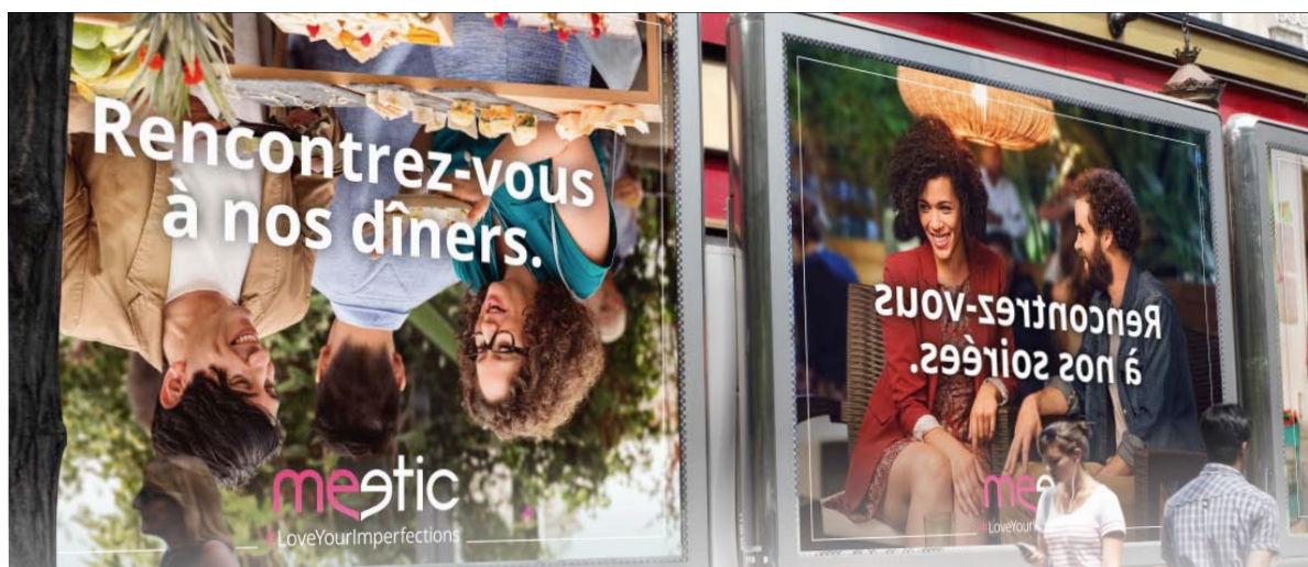
La campagne d'affichage teasing a démarré le 15/12

Meetic est tout aussi imparfaite que ses célibataires. Afin de l'illustrer, elle a lancé une campagne de teasing orchestrée par Vizéum : depuis le 15 décembre, à Paris, une campagne d'affichage truffée d'imperfections (typographie et image à l'envers, faute de frappe, présence d'un « call to action digital ») devient ainsi le prétexte de conversations sur les réseaux sociaux.